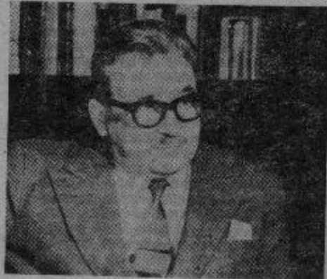
Frigerio: su nombre es sinónimo de entrega