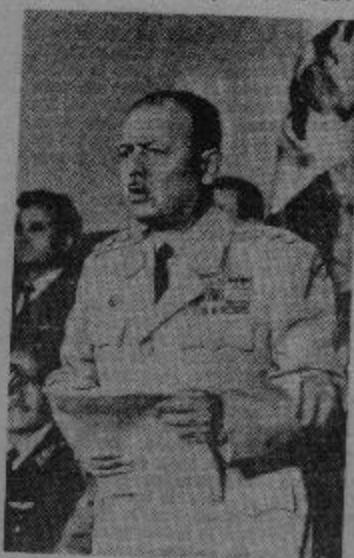
Gral. VELASCO ALVARADO

y siempre puso de lado a las grandes mayorías nacionales". Y agrega enfáticamente: "Por eso, nuestra legitimidad no viene de los votos, de los votos de un sistema político viciado de raíz, por que nunca sirvió