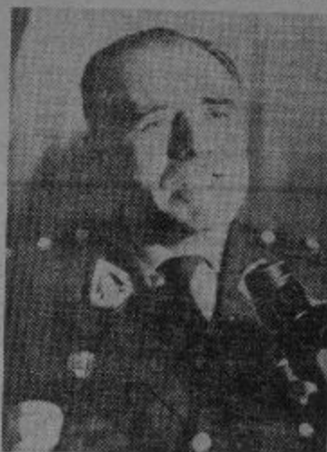
CANCILLER MERCADO JARRIN

Por todo esto "la vuelta al orden constitucional, que tanto reclaman nuestros adversarios, se producirá únicamente cuando se haya garantizado la permanencia de la revolución y su continuidad, únicamente cuando en una nueva Constitución se consa-