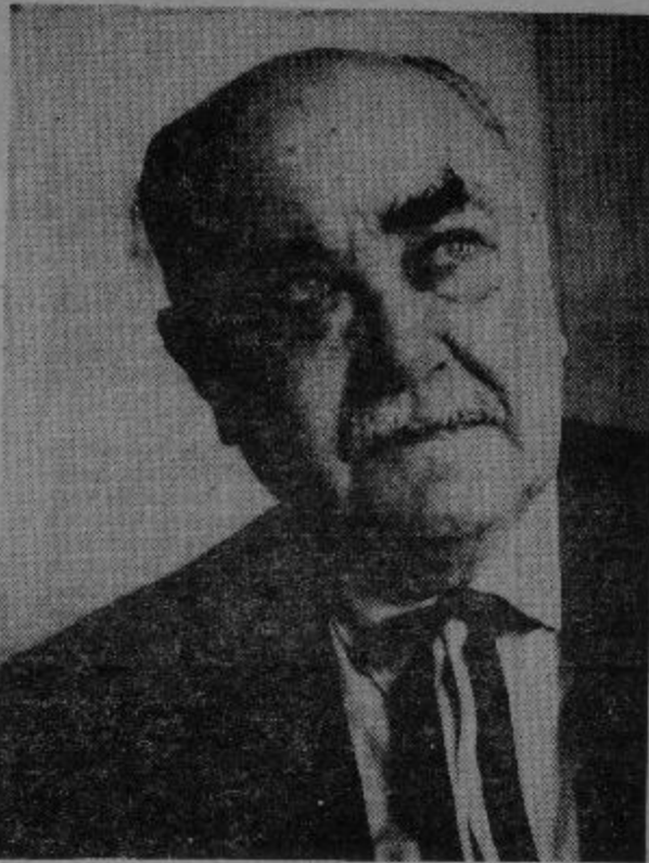
"La empresa es como la lues, hereditaria"