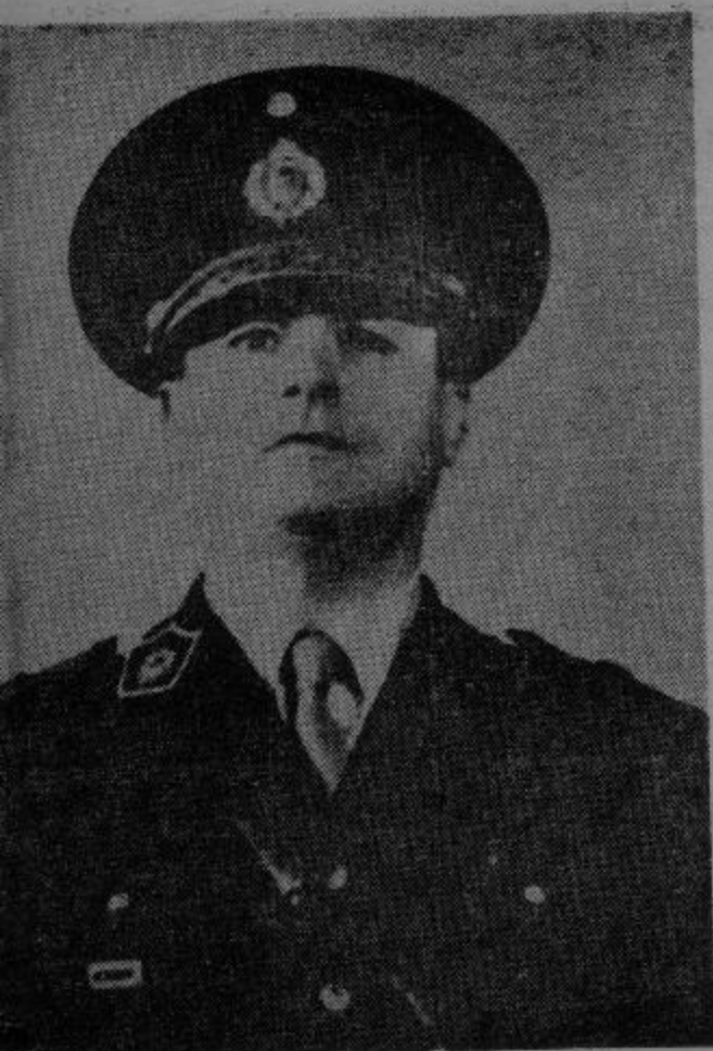
GENERAL MANUEL SAVIO

para la recuperación decisional de la Revolución Nacionalista