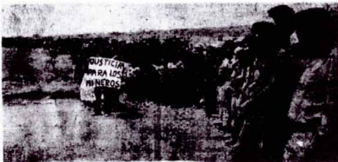
"c) JUZGAMIENTO DE LOS DELINCUENTES POLITICOS, USURPADORES DEL PODER, etc."

Será este un gobierno que represente e interprete los intereses y aspiraciones de las más amplias masas populares. La clase obrera, por ser la clase productora, la clase que crea con su trabajo diario todas las riquezas de la sociedad, será la clase dirigente del proceso revolucionario hacia la paz, el progreso y la prosperidad del pueblo.