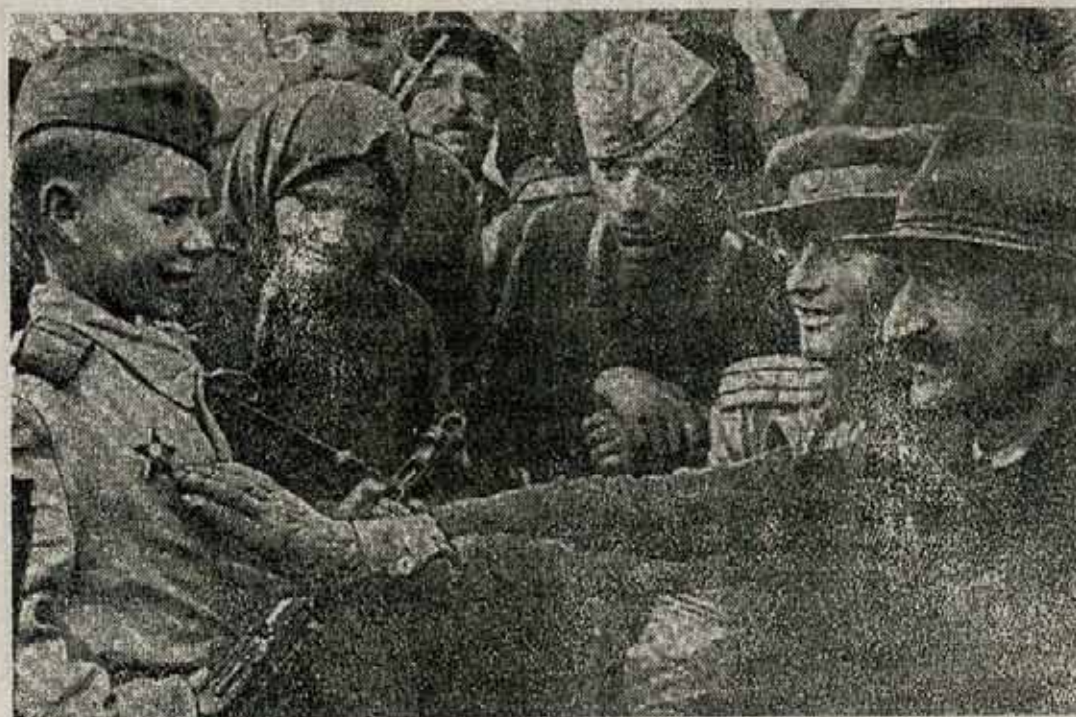
Con las armas en la mano tomó parte en las liberación de la tierra yugoslava ocupada por los fascistas.