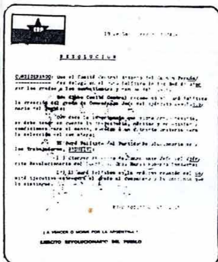
Reproduccion de las resoluciones de entrega de grados del Buró Político.

mación de los mandos es decisivo. El papel de introducir la dirección, el empuje, la línea y el estilo de trabajo proletario de nuestro Partido, es fundamental.