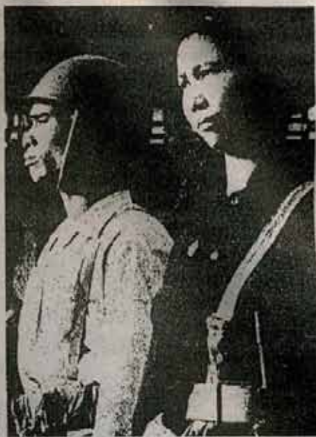
"Las milicias populares, las fuerzas guerrilleras, los grupos de autodefensa constituyen las fuerzas armadas de los trabajadores", Giap.

buenos cuadros a las tropas regionales y regulares" (Giap "Guerra de Liberación páginas 46-47).