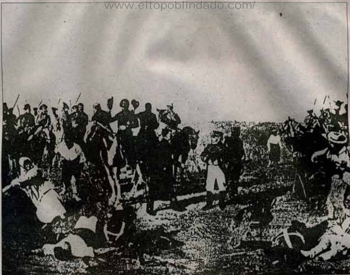
Rendición de posadas en la Batalla de Las Piedras.

podamos disfrutar de nuestros derechos y acabar con la esclavitud y la miseria. ¡Compañeros, paisanos, adelante! Y que nadie tema porque la patria agradecerá sus esfuerzos y un día descansaremos todos de nuestras fatigas en una gran familia unida y victoriosa. ¡Paisanos amigos, VIVA LA PATRIA!