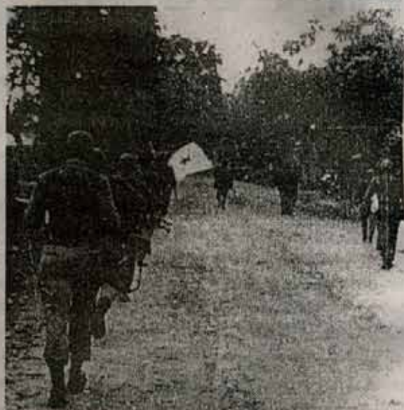
"...A un revolucionario muerto no se lo debe llorar, sino que se lo debe reemplazar..."

En cuanto a ti mi hijo, cuanto no eran mis deseos de tenerte a mi lado para abrazarte y besarte ya que no tuve la suerte de darle el último beso a mi hijo querido, a mi gordo, nosotros cuando fuimos, hacía como 8 días que estaba muerto, el féretro