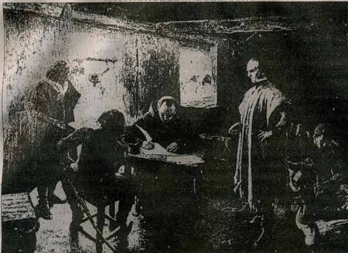
Artigas dictando instrucciones para las tropas.

sudeste del pueblo. Posadas —el jefe español— ha tratado de dejar libre la ruta a Montevideo, según la suerte de la acción.