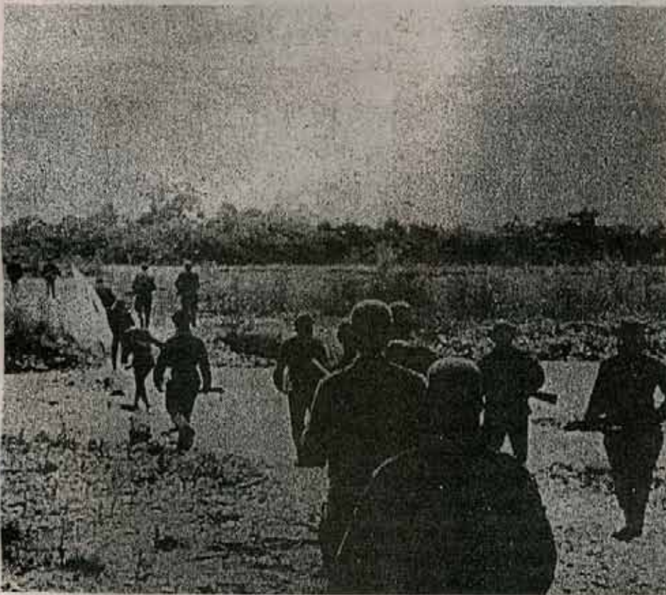
Parte de la compañía de Monte durante una marcha