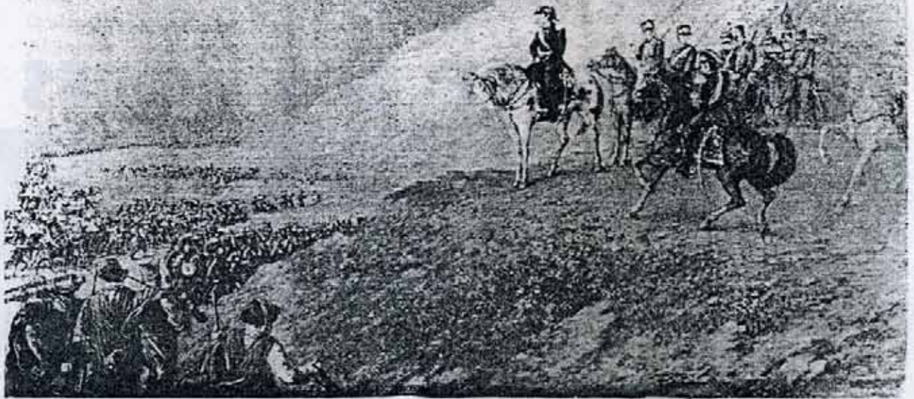
El Ejército de los Andes fue fruto del sacrificio y el esfuerzo patriótico de todo un pueblo.

de cooperación económico-militar por medio de un sistema de auxilios patrióticos, servicios gratuitos, impuestos extraordinarios, contribuciones de todo tipo. Algunos pobladores proveían de armas, otros de dinero, otros ofrecían su trabajo. Todos comprendían el porque de sus esfuerzos y se sacrificaban gustosamente.