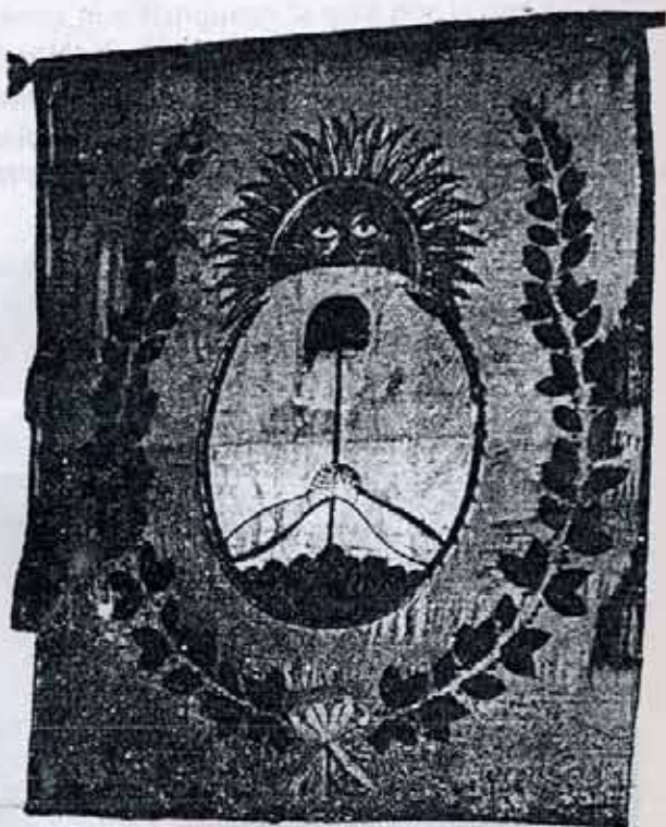
La Bandera del Ejército de los Andes, blanca arriba, azul celeste abajo y con el Escudo Nacional en el centro. El Ejército Libertador la llevó al triunfo en toda Latinoamérica.

El esfuerzo de los patriotas cuyanos fue coronado con la victoria. San Martín cumpliendo paso a paso su genial plan estratégico iniciaba al cruzar la cordillera el camino de la liberación definitiva del yugo español.