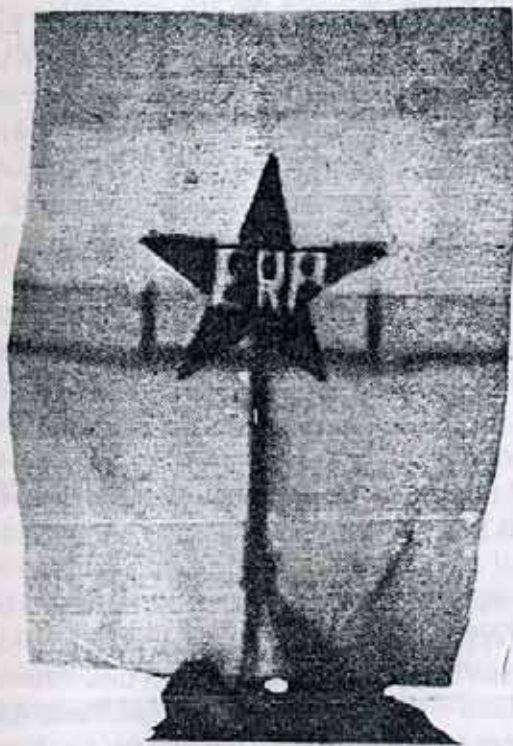
Nuestro Ejército ha tomado los colores de la Bandera de los Andes, inscribiendo en su centro la Estrella Roja de cinco puntas, símbolo de la lucha solidaria de los cinco continentes.