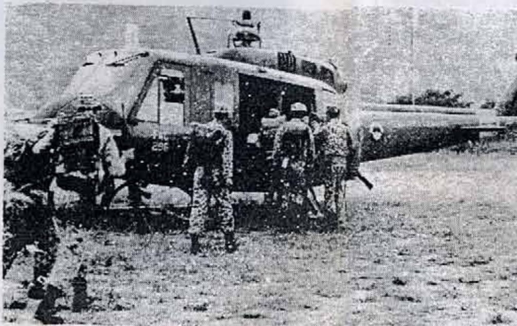
COMO EN VIETNAM EL EJERCITO OPRESOR ES ASESORADO POR INSTRUCTORES YANKIS.

Los combatientes del ELN, apostados en los cerros que flanquean la ruta por la que se desplazaba el convoy militar, dañaron seriamente un primer vehículo con granadas y alcanzaron a otros con fuego cruzado de armas automáticas. El enfrentamiento se