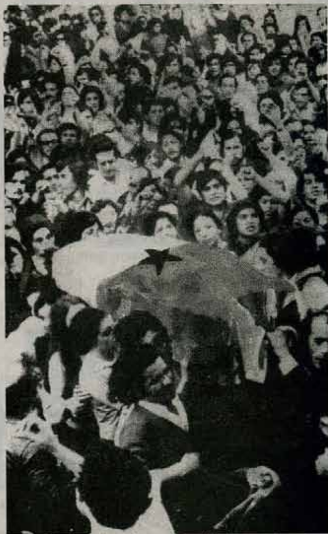
En Tucumán no lograron impedir el homenaje.

En Córdoba, la CGT, ofreció su local para el velatorio