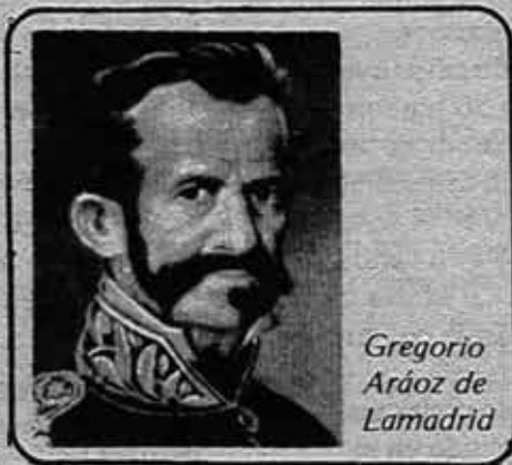
Gregorio Aróz de Lamadrid

El 31 de enero de 1816 Lamadrid esperó al enemigo al pie de los cerros desde cuyas cimas lo apoyaban los indígenas. Aunque en inferioridad numérica se batió en valiente combate y a pesar de sucesivos fracasos rehizo al llegar la noche su escuadrón, situándose a corta distancia del enemigo. La noche se pasó en estado de alarma tanto