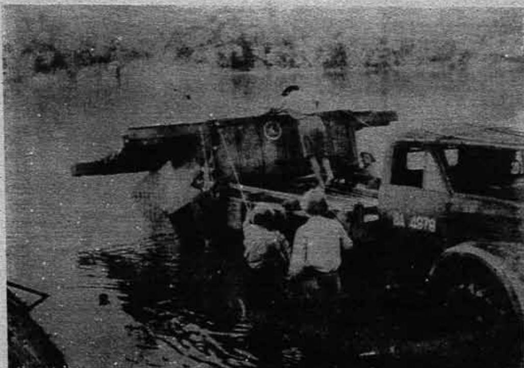
...ESA MISMA NOCHE CIENTOS DE CAMIONES CRUZARON EL RÍO POR EL PASO SECRETO...

-Si la 9a. Compañía cumple pasivamente la orden de voladura del camión les costará