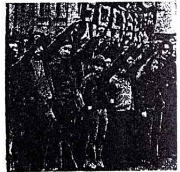
Los reos de los compañeros Mesa, Sida y Moses son despedidos con el punto en alto y la firmeza del compromiso contraído.