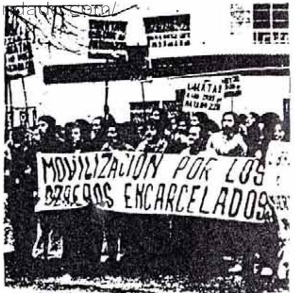
Movilización obrera por los compañeros de Matarazzo que estaban detenidos.