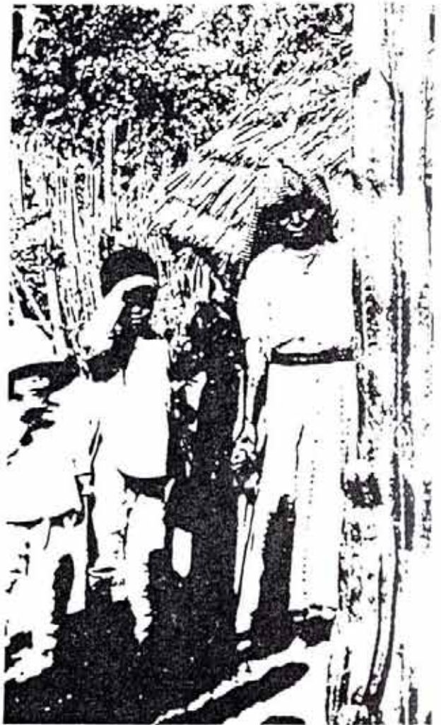
Familia campesina mexicana

El planteo no puede ser más falso y engañoso. Francisco Villa, como Emiliano Zapata, están sí incorporados a la historia "oficial" de México, pero despojados de su auténtico contenido revolucionario. Lo que la burguesía ha hecho es utilizar las figuras de esos caudillos populares, sus luchas y las del campesinado para presentarse ante las masas como la