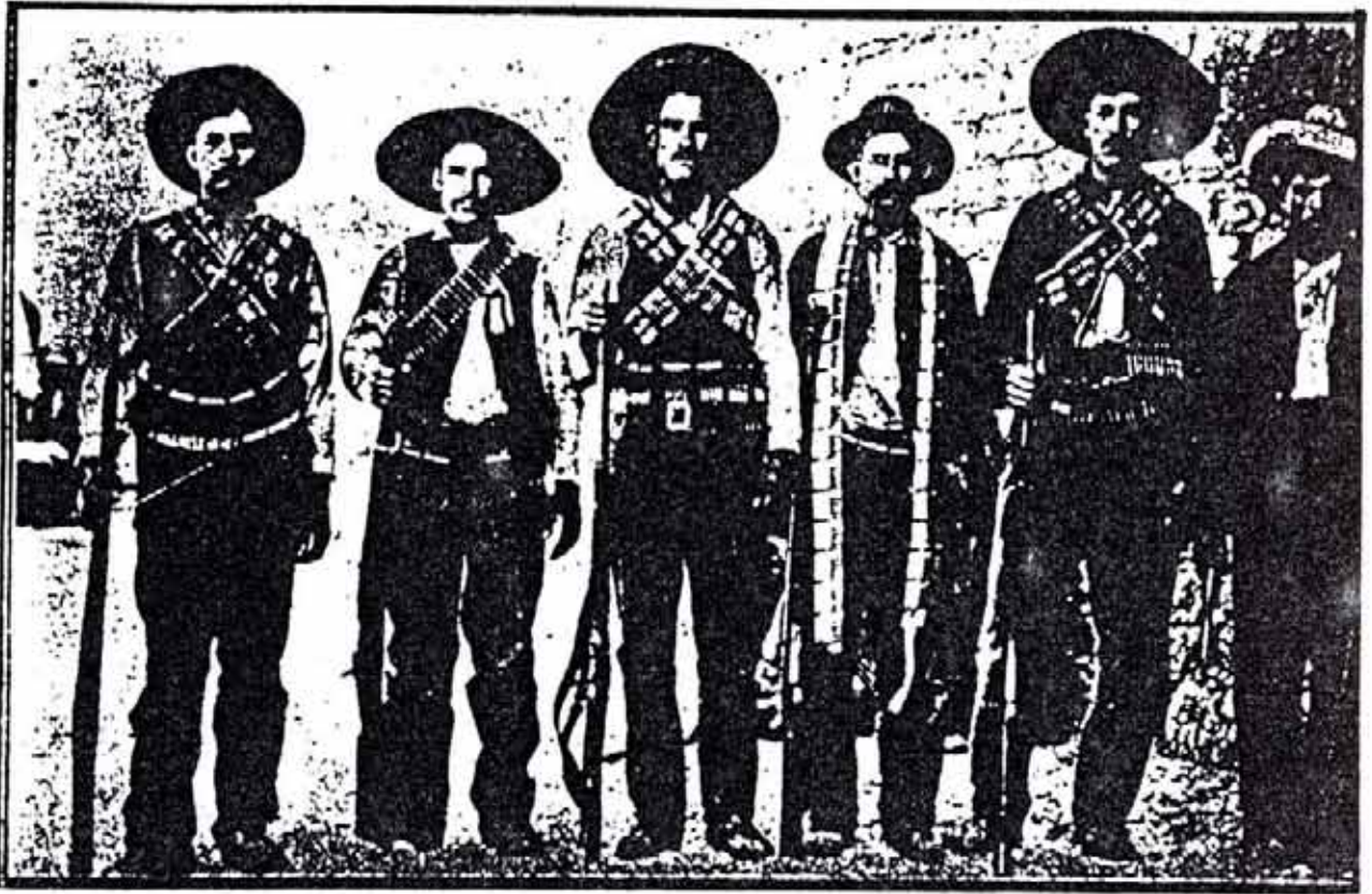
Miembros del ejército revolucionario de Pancho Villa

por los "pacificadores"; o que más de tres millones de campesinos carecen hoy de tierras para cultivar, mientras la reforma agraria burguesa ha convertido a millones de agricultores pobres en proletarios rurales sobreexplotados que venden su fuerza de trabajo en grandes haciendas capitalistas, muchas de ellas directamente controladas por el imperialismo yanqui. El ahora secuestrado candidato a gobernador para más, tiene otros antecedentes de su vocación amnistiadora. Por espacio de dos años, proclamó su "amistad" con otro combatiente de Guerrero, Genaro Vázquez Rojas, fundador de la Acción Cívica Nacional Revolucionaria y uno de los líderes populares más esclarecidos y consecuentes que tuvo México, asesinado por patrullas del ejército en 1968. Figueroa intentó en distintas oportunidades utilizar el prestigio que Genaro Vázquez y su organización armada supo ganarse en el corazón y la mente de las masas campesinas y en sectores de vanguardia del proletariado y de otras capas populares de las ciudades, pretendiendo tender falsos puentes entre la ACNR y el PRI. La acción firme y decidida de la guerrilla dejó al descubierto la torpe y grotesca maniobra; a la muerte del dirigente revolucionario, seguido por una feroz represión que se extendió por las sierras y los centros poblados, Figueroa se apresuró a declarar la