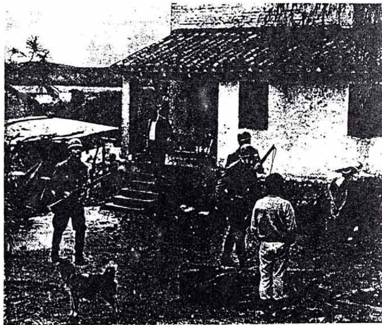
EL PUEBLO DEBIO SUFRIR COMO SIEMPRE LA PREPOTENCIA Y EL ATROPELLO DE LAS FUERZAS REPRESIVAS.

dedicando a ella su vida. Detenido en Tucumán, en el año 1971, luego de la expropiación del Banco Comercial del Norte, participó en el combate de VILLA URQUIZA, donde un importante grupo de compañeros logró evadirse de este penal, donde soportaban el cautiverio de la dictadura. Recuperada la libertad, se reintegró activamente a la lucha revolucionaria. Detenido nuevamente, fue muerto a golpes por la policía tucumana. Al dar su nombre a nuestra primera unidad de monte simbolizamos con ello, no solo nuestro homenaje al querido compañero, sino también a todos los obreros tucumanos, que como él forman parte de nuestro pueblo y que sabrán llevar hasta el victorioso final la lucha por la Patria Socialista.