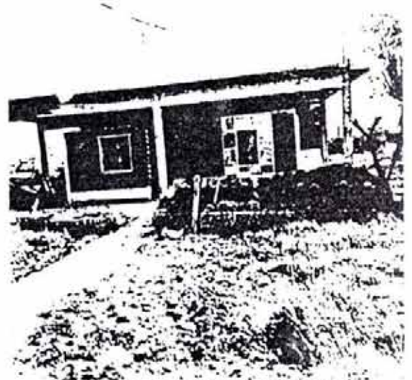
Destacamento policial de Gerli copado por un comando del ERP.