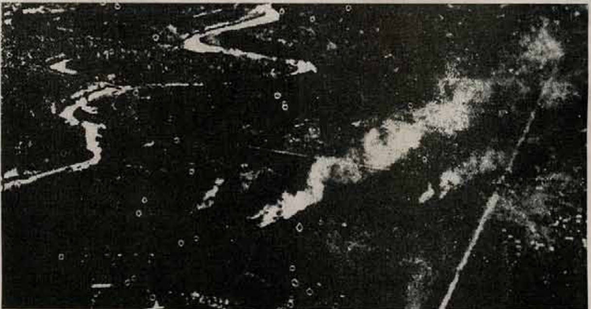
Vista aérea del campo fortificado de Dien Bien Phu durante el sitio de las fuerzas vietnamitas

En Dien Bien Phu aniquilamos e hicimos prisioneros a 16.200 hombres, incluido todo el mando del campo fortificado —un general, 16 coroneles, 1.749 oficiales y suboficiales—, abatido o destruido en tierra 62 aviones de todos los tipos, ocupados todos los armamentos, municiones y equipos del enemigo, principalmente más de 30.000 paracaídas.