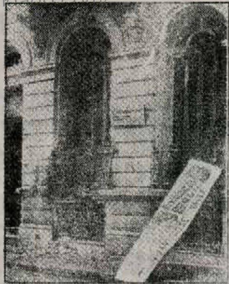
Atentado fascista contra la Unidad Básica Juan J. Valle de la Juventud Peronista

31 Grand Bourg, Bs.As. Miembros de la policía ferroviaria atacan a golpes y balazos a pasajeros de un tren, hiriendo de gravedad a uno. La reacción po-