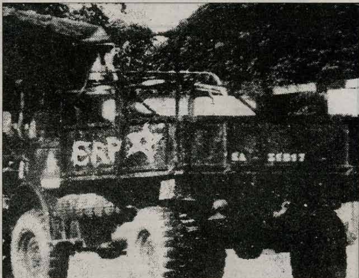
UNO DE LOS VEHICULOS DE LA UNIDAD MILITAR ENEMIGA EN QUE SE RETIRO EL ARMAMENTO RECUPERADO

Políticamente, confirmó la corrección de la orientación que nuestra organización supo imprimir a su accionar, influyendo decisivamente en los acontecimientos