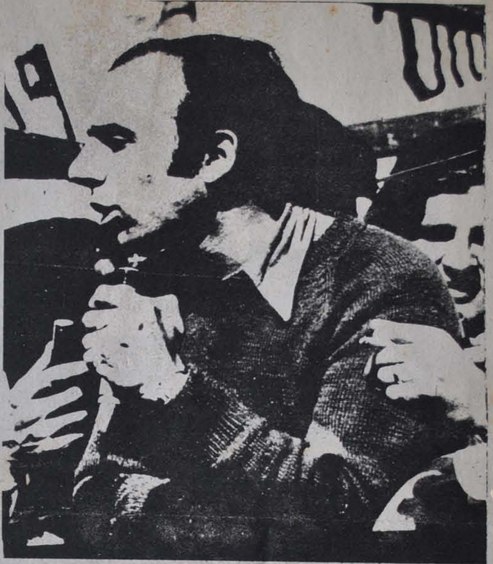
Habla un combatiente del ERP

Así transcurrió el cuarto aniversario del Cordobazo. Las banderas del Socialismo y de la guerra llevadas por las masas, fueron su distintivo y a la vez la prueba más clara de que la clase obrera y el pueblo argentino, junto a sus organizaciones armadas, está dispuesta a transitar sin claudicaciones, el duro pero glorioso camino de la guerra revolucionaria para llegar a la Patria Socialista.