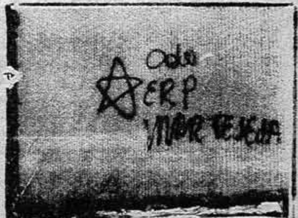
La vanguardia armada se prepara para lanzar los nuevos y mas poderosos golpes que las masas reclaman.

ración y simpatía de todo el pueblo, los combatientes liberados permanecieron en libertad gracias al apoyo recibido de todos los sectores. En Córdoba: más de mil obreros concurren a despedir y manifestar su solidaridad a quienes visitaban a los presos de Rauson, en dos ómnibus fletados por el movimiento obrero clasista. En Santiago del Estero numerosas personas del pueblo manifestaron su solidaridad con nuestros combatientes perseguidos y ocultaron del enemigo a los que se encuentran prófugos.