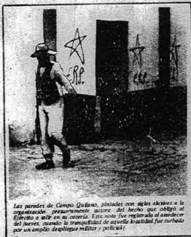
Las paredes de Campo Quijano, pintadas con siglas afines a la organización, presuntamente autora del hecho que obligó al Ejército a salir en su cacería. Esta nota fue registrada al atardecer del jueves, cuando la tranquilidad de aquella localidad fue turbada por un amplio despliegue militar y policial!

Esta situación ha llegado a su máximo con el copamiento y posterior desbarrancamiento de un colectivo