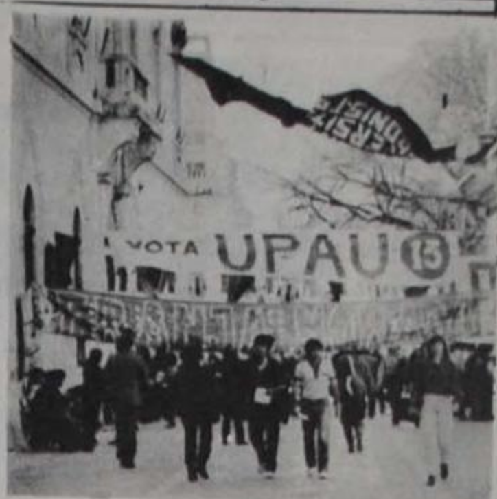
segundo año consecutivo la conducción del centro.

Desde principios del año lectivo, las distintas agrupaciones que trabajan políticamente en la Universidad han venido manteniendo conversaciones a fin de lograr coincidencias que permitieron lograr la