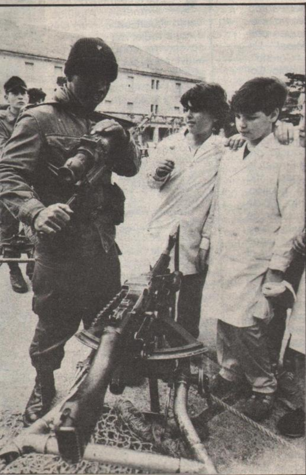
¿Estos niños serán el enemigo interno de mañana?

Con el fin de adoptar "decisiones finales sobre la propuesta de Estados Unidos para la creación de un Sistema Educativo Interamericano y sobre los convenios de intercambio recíproco", se realizará en Mar del Plata, del 7 al 14 de noviembre próximo, la XVI Conferencia de Ejércitos Americanos.