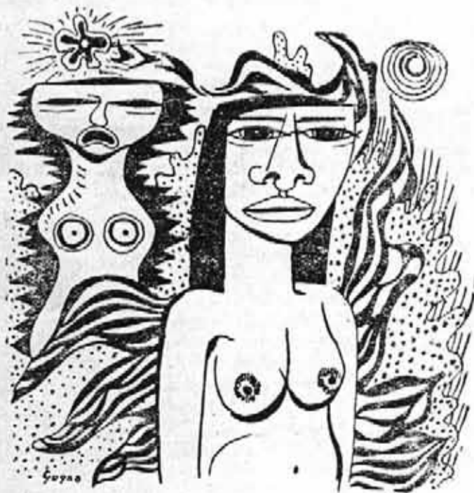
Ilustró: Alfredo Gogna

Elo ha ocurrido empero siempre que estuvieron dadas una serie de constantes que posibilitaron la cristalización de dicho sentimiento, porque cuando no existieron ellas, fué imposible toda identidad. Numerosos fracasos ocurridos en el curso de la historia, cada vez que se intentó estabilizar sociedades sin esa base previa, ratifican la evidencia; más aún los estériles esfuerzos de hoy por estructurar confederaciones estatales al margen de esas premisas fundacionales.