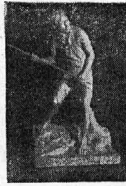
"Pescador del Dulce"

Como todo artista agudo y sensible, que sabe comprender, sentir y sufrir al lado del pueblo, Delgado, a través de su obra, se ha connaturalizado con el sufrir y sentir del suyo. Porque el santiagueño, tan noble en su conducta y en su proceder, tan castigado por los rigores de la pobreza, por la aridez de sus tierras salitrosas y por sus inclementes veranos, es un pueblo sufrido. Así, "Las rezadoras" nos impresionan en su actitud transida; "El hachero", en su duro esfuerzo de ganarse el pan diario; en el "Paisano golpeando la caja" vemos aflorar la emoción en el rostro de quien se vale de un instrumento para exteriorizar lo que no podría hacerlo con la pa-