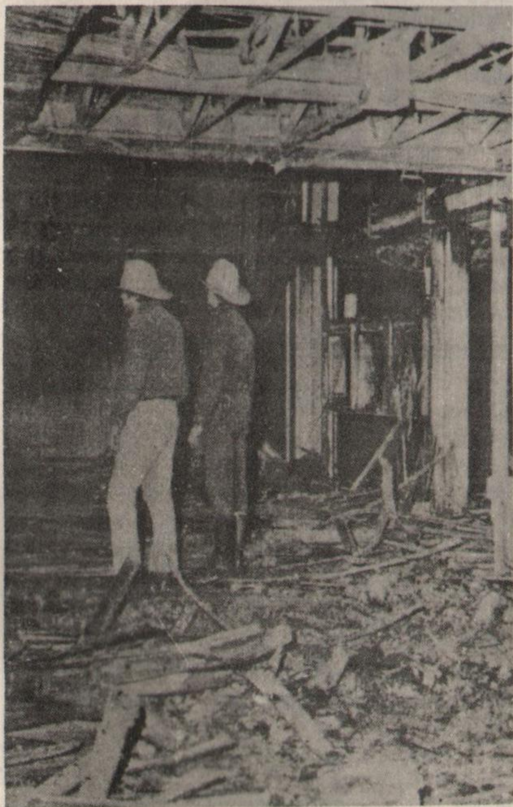
También las concesionarias fueron atacadas

Un suboficial de la Policía Federal es ajusticiado el 20 de julio en la Capital. El 21, se ametralla la Comisaría 1a. de Avellaneda y el 22 la Comisaría de Villa Pinerol en Caseros. En La Plata es ametrallada el 25 la Comisaría 9a., y en el Chaco un pelotón montonero arroja granadas contra la Unidad Especial de Investigaciones, principal centro de torturas en la zona.