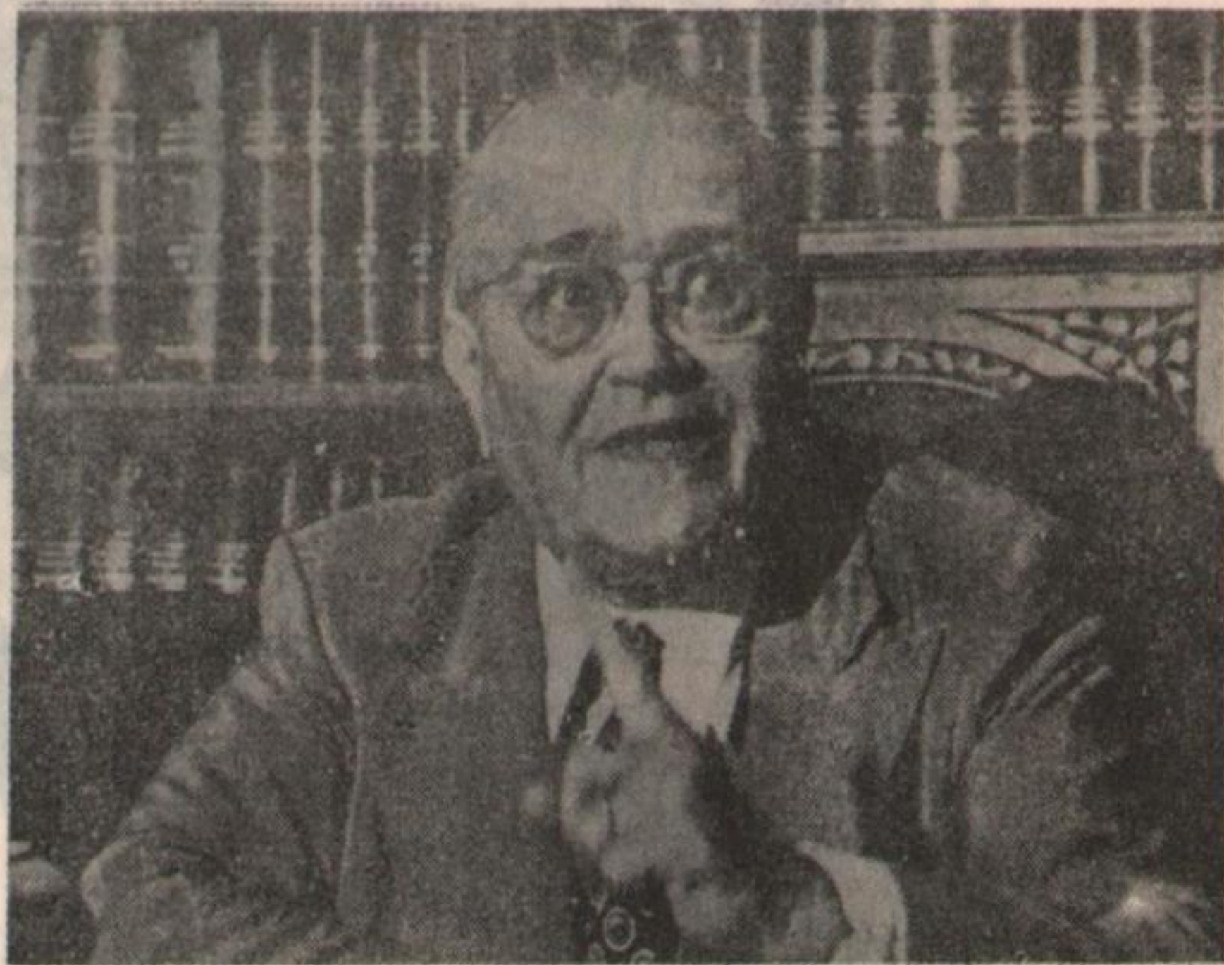
Nunca clavó en una cita a Isabel y López Rega.

Cuando el lopezrreguismo hizo agua por todos los costados, Balbín volvió a golpear la puerta de los cuarteles. Quería un golpe, otra proscripción del peronismo, una nueva oportunidad, para ver si llegaba a presidente en elecciones tramposas. Ahora la Martínez ha formado un gabinete con militares, vanderistas y representantes de la partidocracia liberal. Balbín seguirá siendo el fiel aliado de siempre. Pero sus actos no se pierden en el vacío: la memoria del pueblo registra todo.