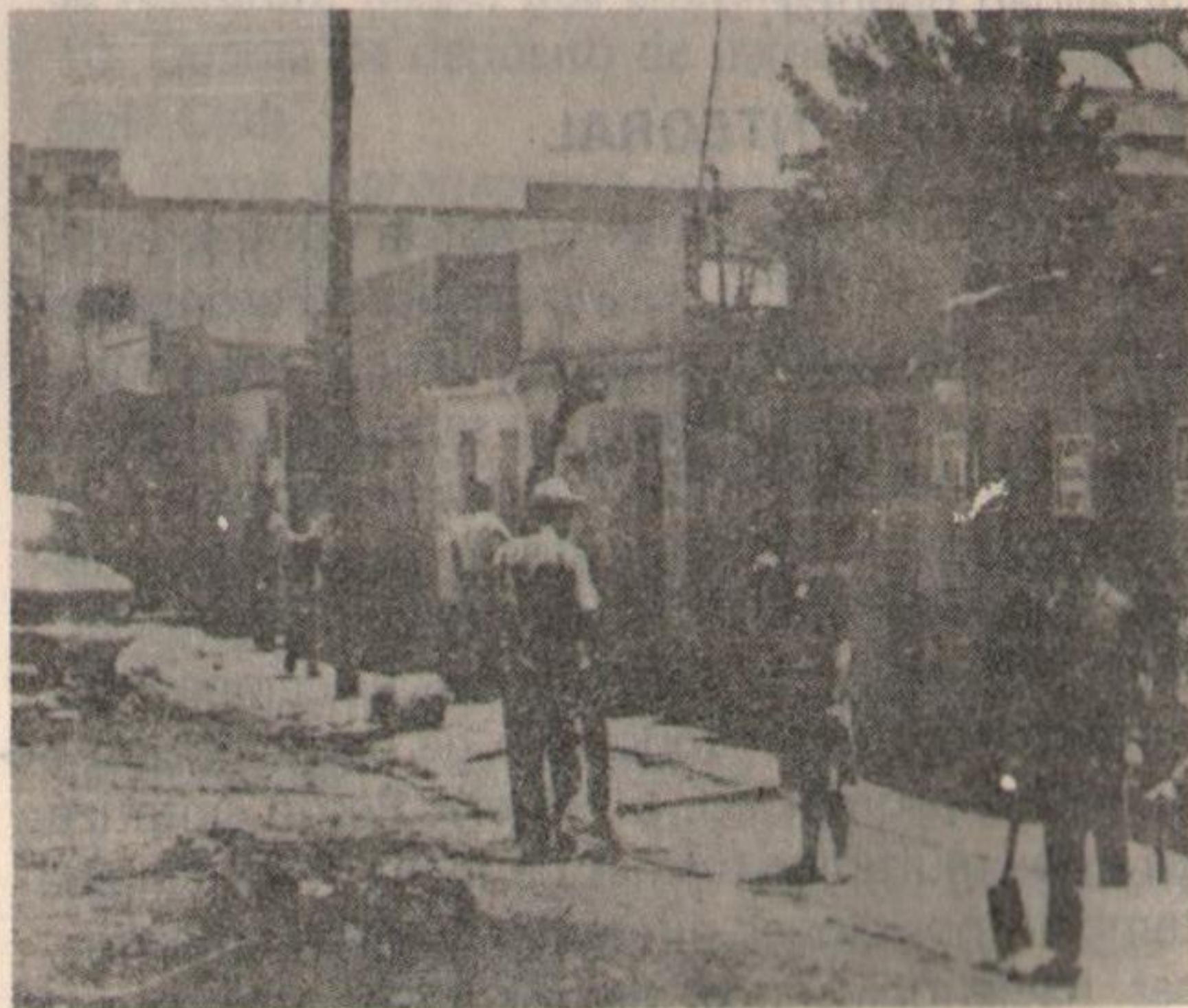
El pueblo organizado y movilizado contruye el poder popular en la calle, fábricas y barrios.