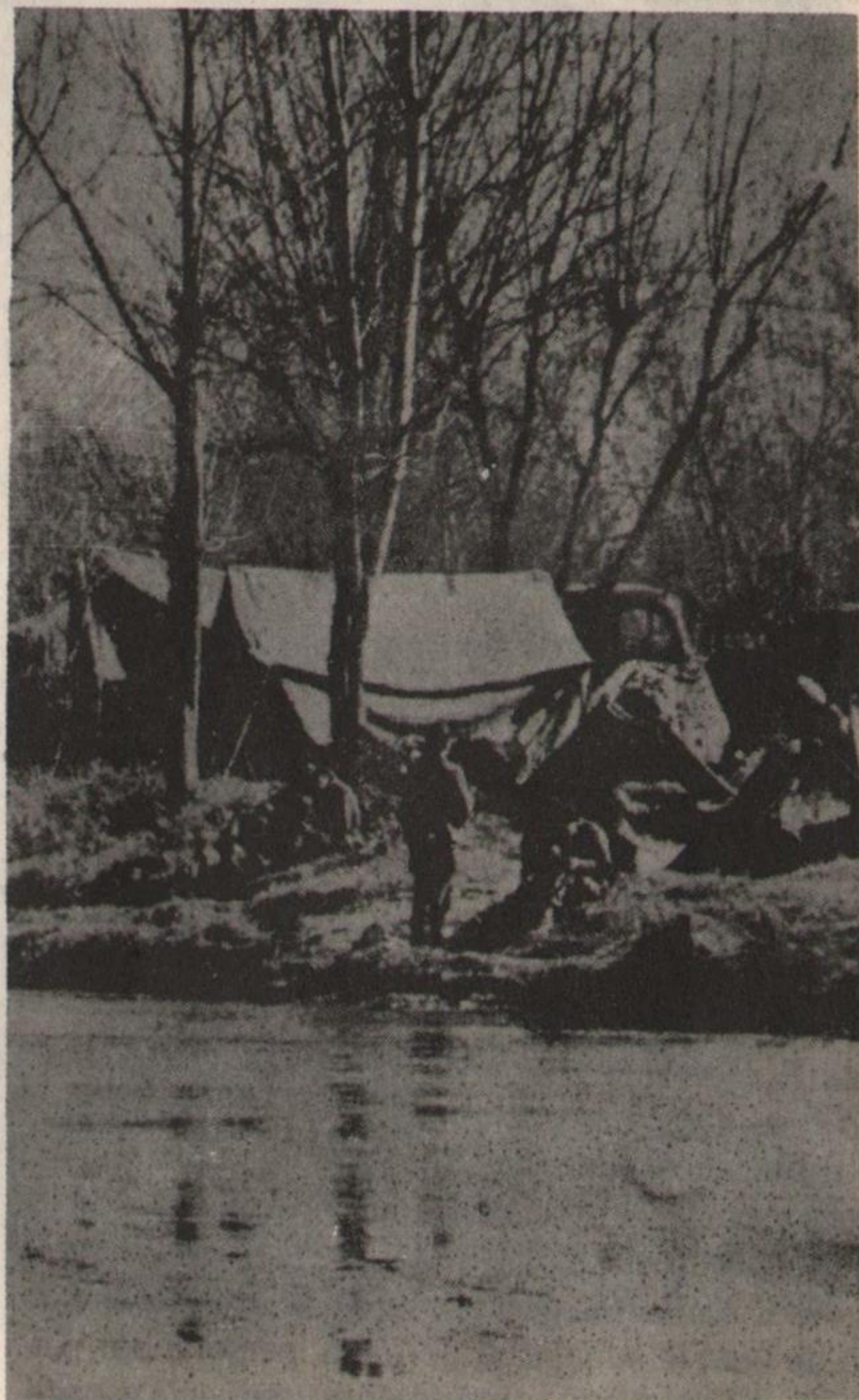
Los oligarcas ponen las tierras a disposición de sus protectores: campamento militar en "La Fronterita"

Los patrones se sienten fuertes. Coincidiendo con la ola de despidos, en Alpargatas suspendieron a 30 trabajadores y echaron a 4; en solidaridad con los compañeros la Asociación Obrera Textil de la zona amenazó con realizar paros. La patronal respondió textualmente: "Hagan lo que quieran, pero no se olviden que la Gendarmería está en la fábrica y nosotros no daremos el brazo a torcer". Ni siquiera se presentaron a la audiencia de conciliación convocada por el Ministerio de Trabajo.