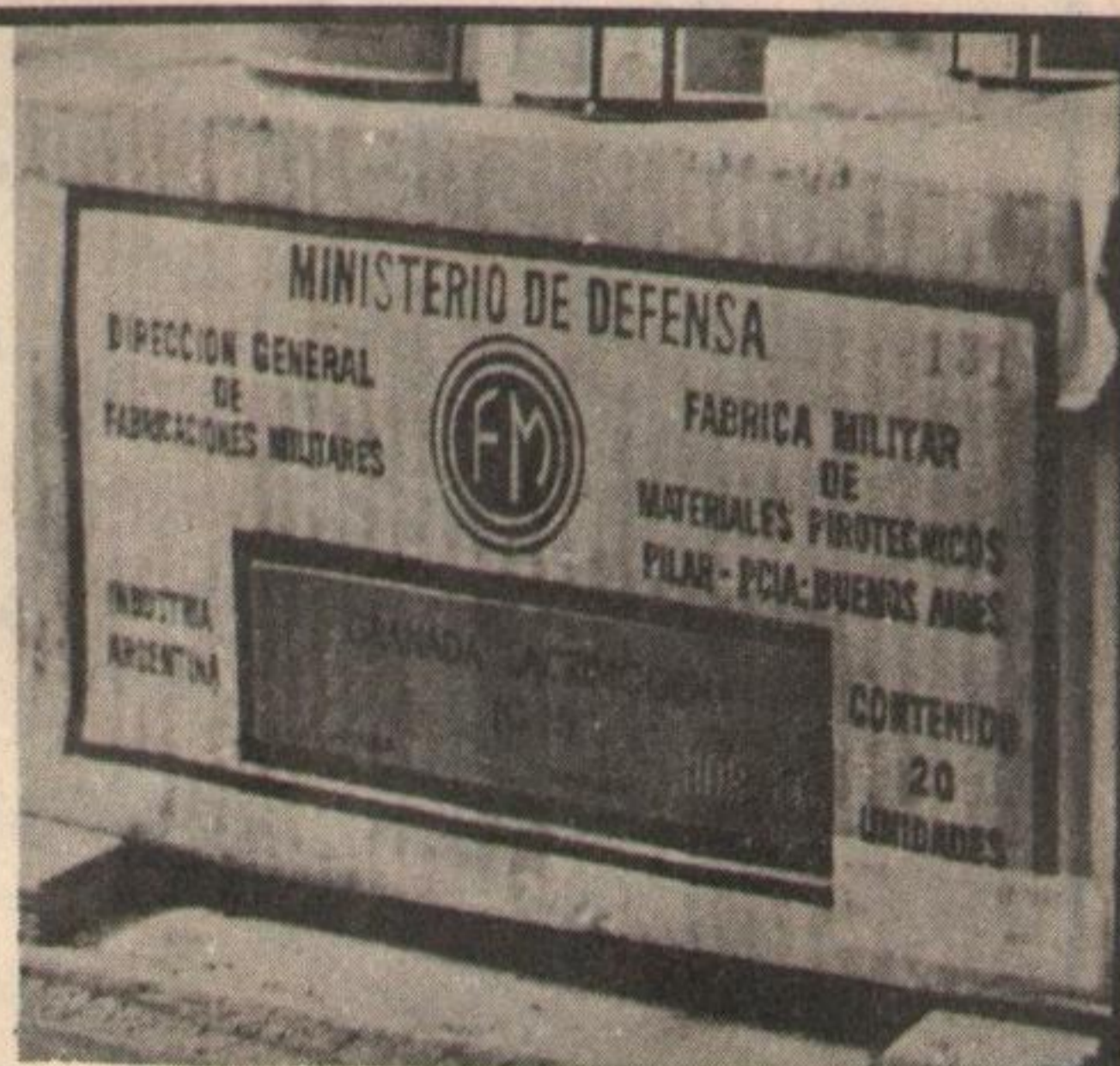
Las dictaduras cómplices en el intento de destruir la voluntad de un pueblo: no pudieron en Nicaragua, tampoco en Argentina.