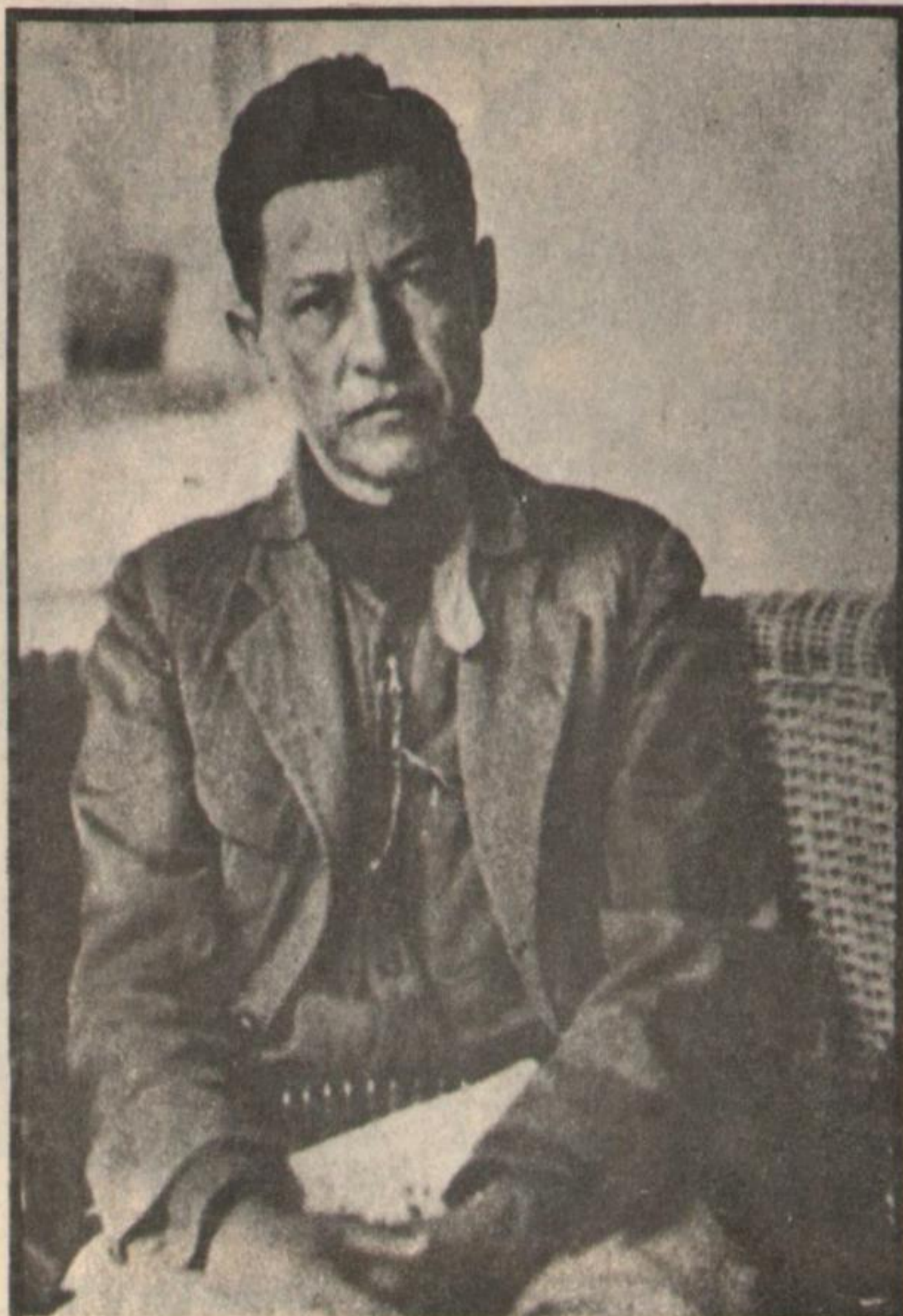
El general Augusto César Sandino, abatido en 1934.

Desde el comienzo de la agresión yanqui se movilizan los pueblos latinoamericanos en defensa de Nicaragua. Sindicatos obreros, federaciones estudiantiles, partidos políticos populares y jóvenes de diversos países aportan todo tipo de ayuda al Ejército Sandinista, incluyendo la participación directa de voluntarios. Y aunque las voces oficiales ocultan la situación del país avasallado, hombres de la talla del argentino Manuel Ugarte o el salvadoreño Farabundo Martí manifiestan públicamente su adhesión, lo que motiva un mensaje del propio Sandino al luchador argentino por la unificación latinoamericana. Por los mismos días, al visitar Buenos Aires el recientemente electo presidente norteamericano Hoover, una gran multitud le expresa su repudio enarbolando retratos del General que continuaba cabalmente la gesta de San Martín, Bolívar, Artigas y Martí.