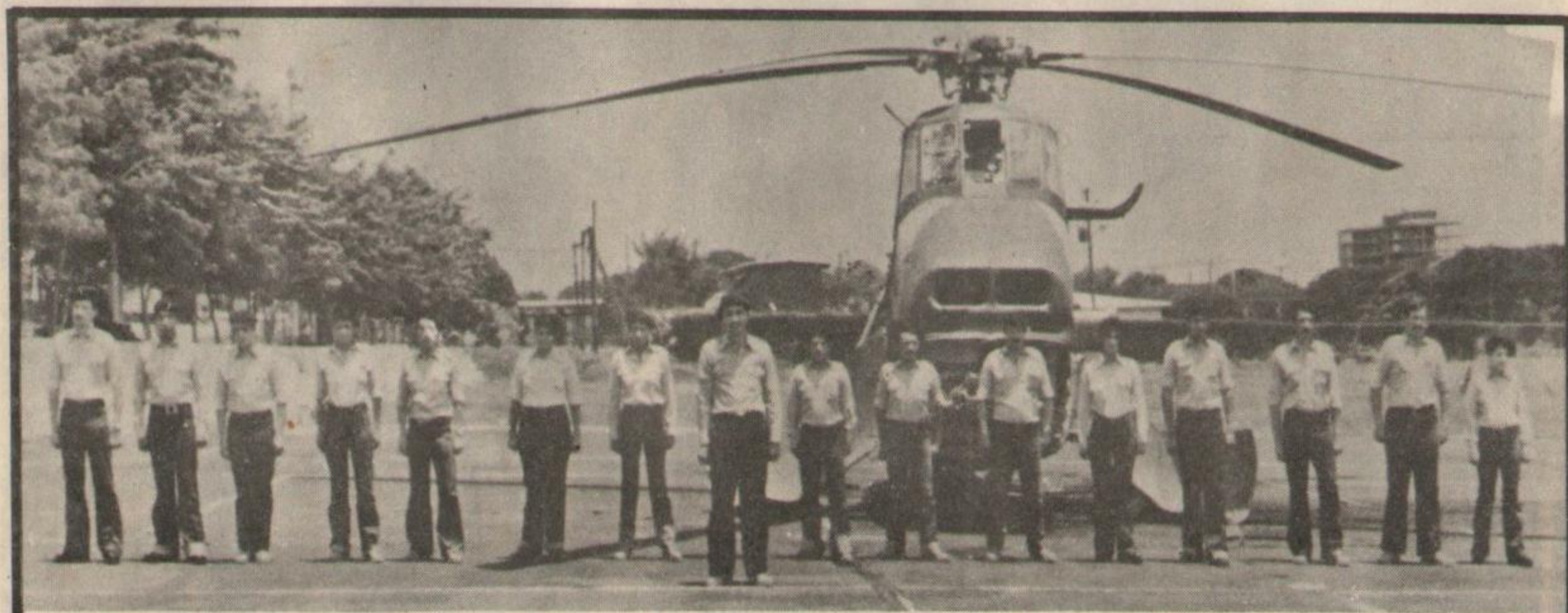
Grupo General San Martín del Ejército Montonero: Solidaridad combatiente.

Entre los años 1956 y 1960 la lucha de los revolucionarios sandinistas, dada la debilidad interna en esos momentos del movimiento revolucionario adoptaba las formas de invasiones, preparadas en los puntos fronterizos del país, con escasa vinculación de masas y la ausencia de organización de vanguardia. Se conocen en este período más de veinte intentos guerrilleros. Es en 1963 con las experiencias armadas de río Bocay, en la zona nor-oriental del país donde surge el FSLN. Con las jornadas guerrilleras de la ciudad y la montaña de los años 1966 y 1967 simbolizadas en la guerrilla de Pancasán, se produce el avance y el desarrollo cualitativo del proceso de guerra sandinista que impulsa el FSLN. Con un mayor trabajo político y organizativo en las ma-