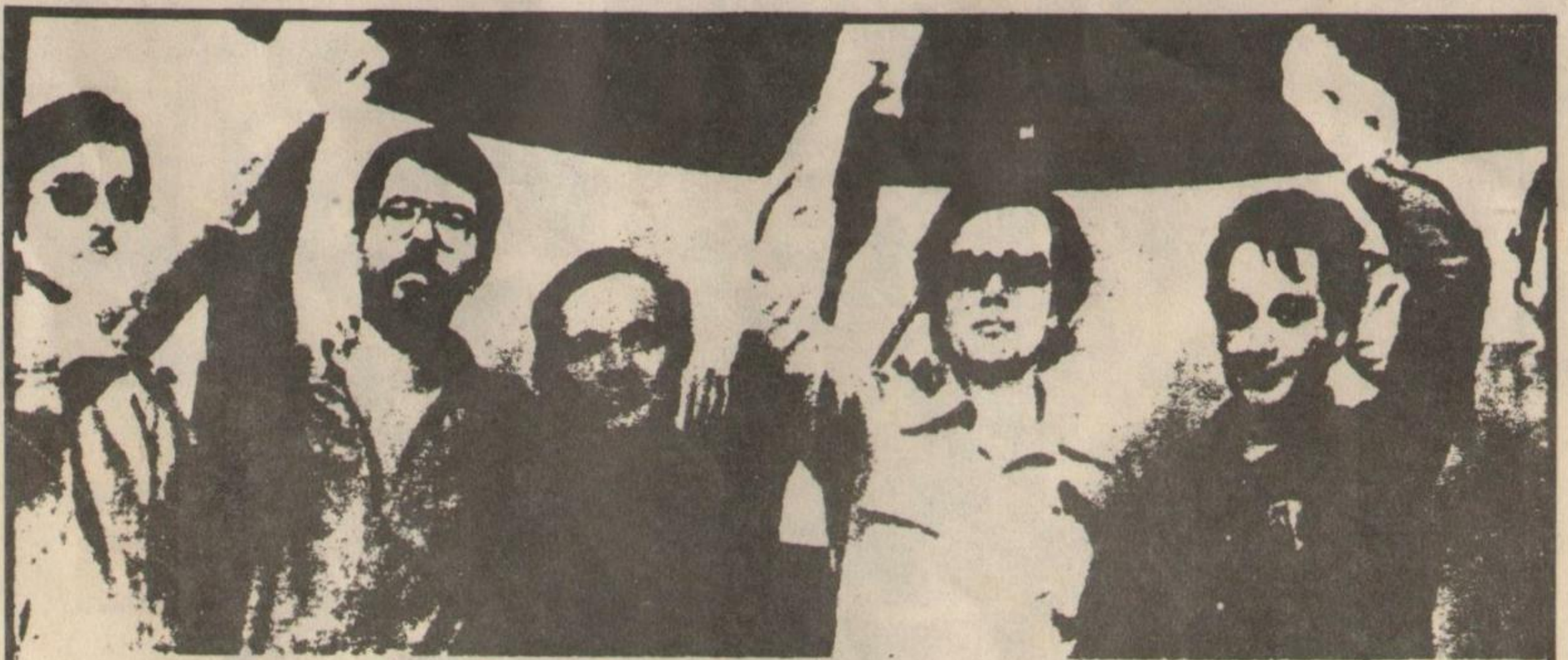
Algunos miembros de la Dirección Nacional Conjunta del FSLN: De izquierda a derecha, Jaime Wheelock, Daniel Ortega, Tomás Borge, Henry Ruiz, Víctor Tirado y Humberto Ortega.

-Luis Carrión -Carlos Núñez -Bayardo Arce