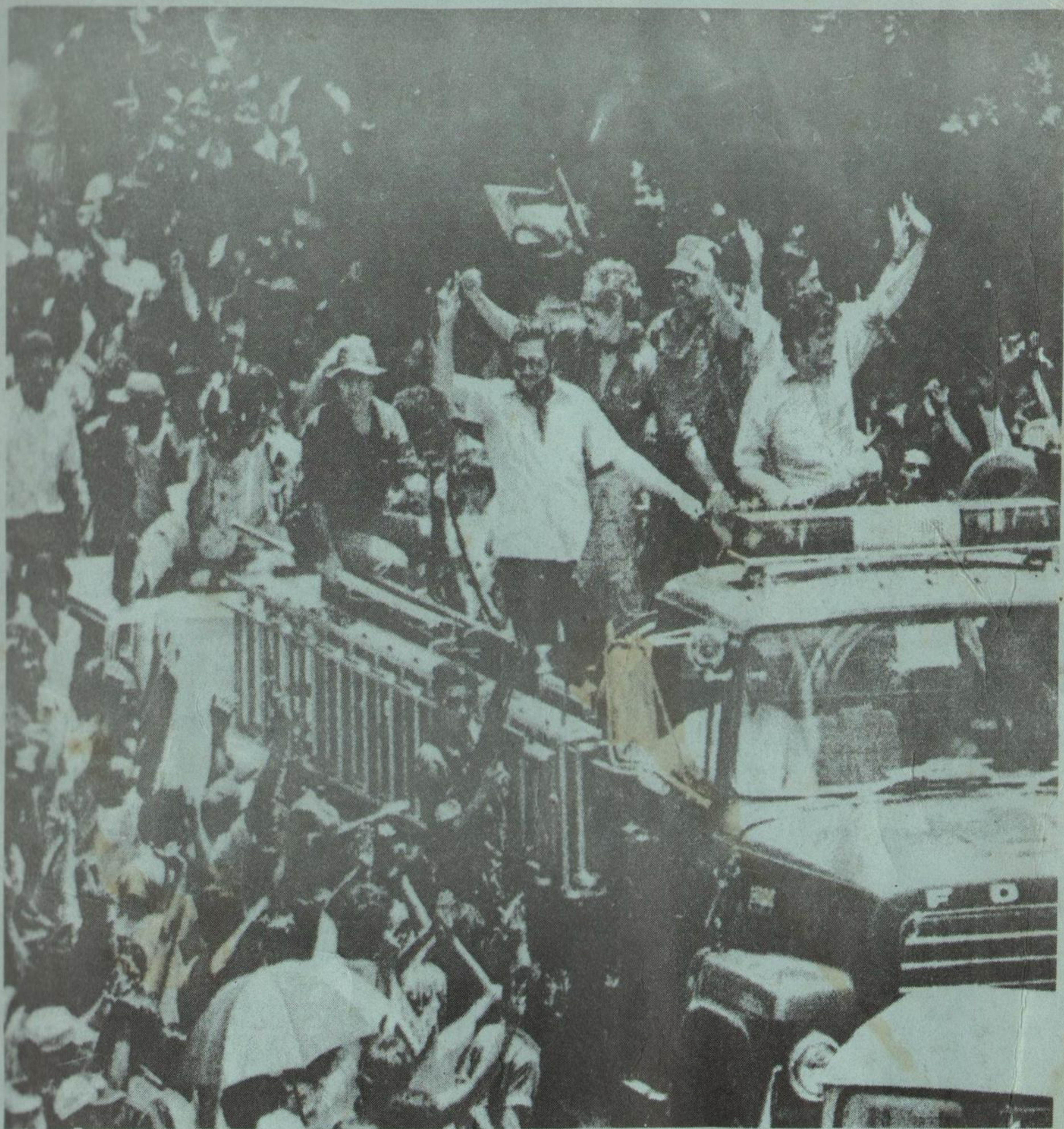
Junta del Gobierno de Recons- trucción Nacional de Nicara- gua: arribo triunfal a Managua