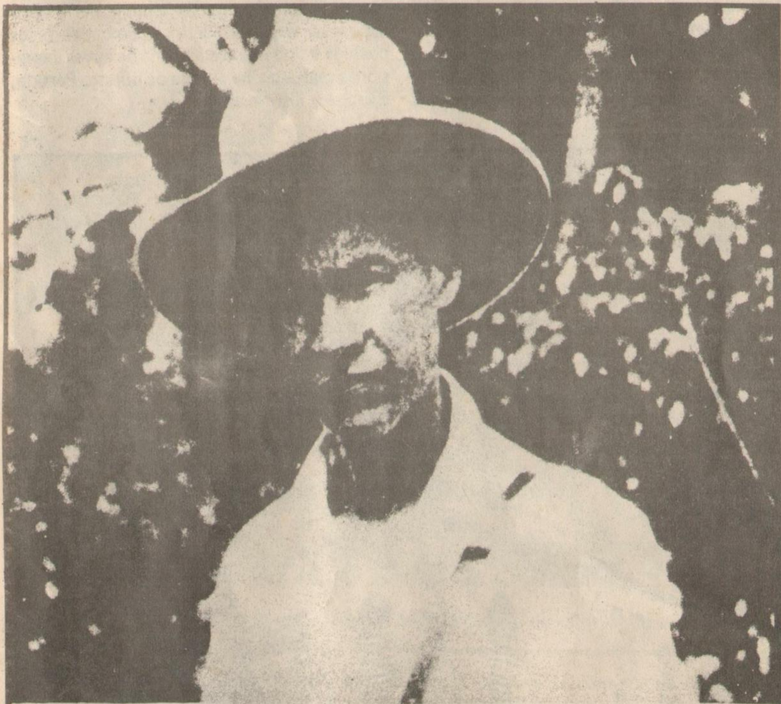
Augusto César Sandino, General de Hombres Libres

América Latina ha sido desde el inicio de las luchas emancipadoras del siglo XIX una zona vital para las empresas de los imperios, tanto en la búsqueda de materias primas como en lo que hace a la expansión del capital financiero. Dentro de ese esquema, acentuado a partir de la política del "gran garrote" de Teodoro Roosevelt, Centroamérica y el Caribe se