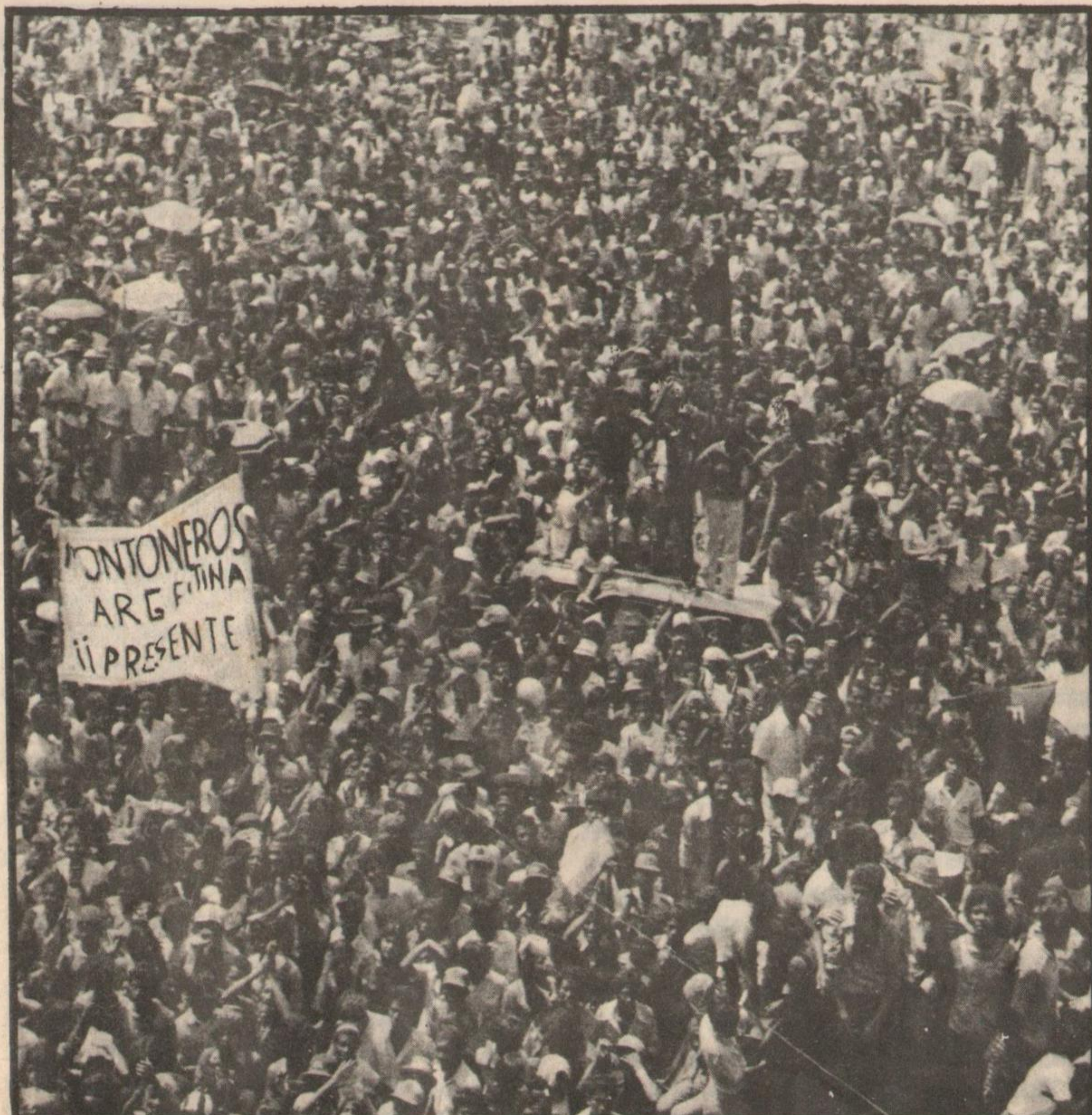
Concentración en la Plaza de la Revolución de Managua (20 de julio) ¡Montoneros Presente!

El triunfo popular de Nicaragua, bajo la conducción del Frente Sandinista de Liberación Nacional, además de representar una victoria para el conjunto de los pueblos latinoamericanos en su lucha de liberación contra las oligarquías y el imperialismo yanqui, implica la certificación de las ligazones políticas, económicas y militares que vinculan a las dictaduras del subcontinente. Los regímenes proimperialistas de Somoza y Videla evidenciaron una completa unidad de objetivos, al mismo tiempo que el Peronismo Montonero y el Frente Sandinista de Liberación Nacional mostraban