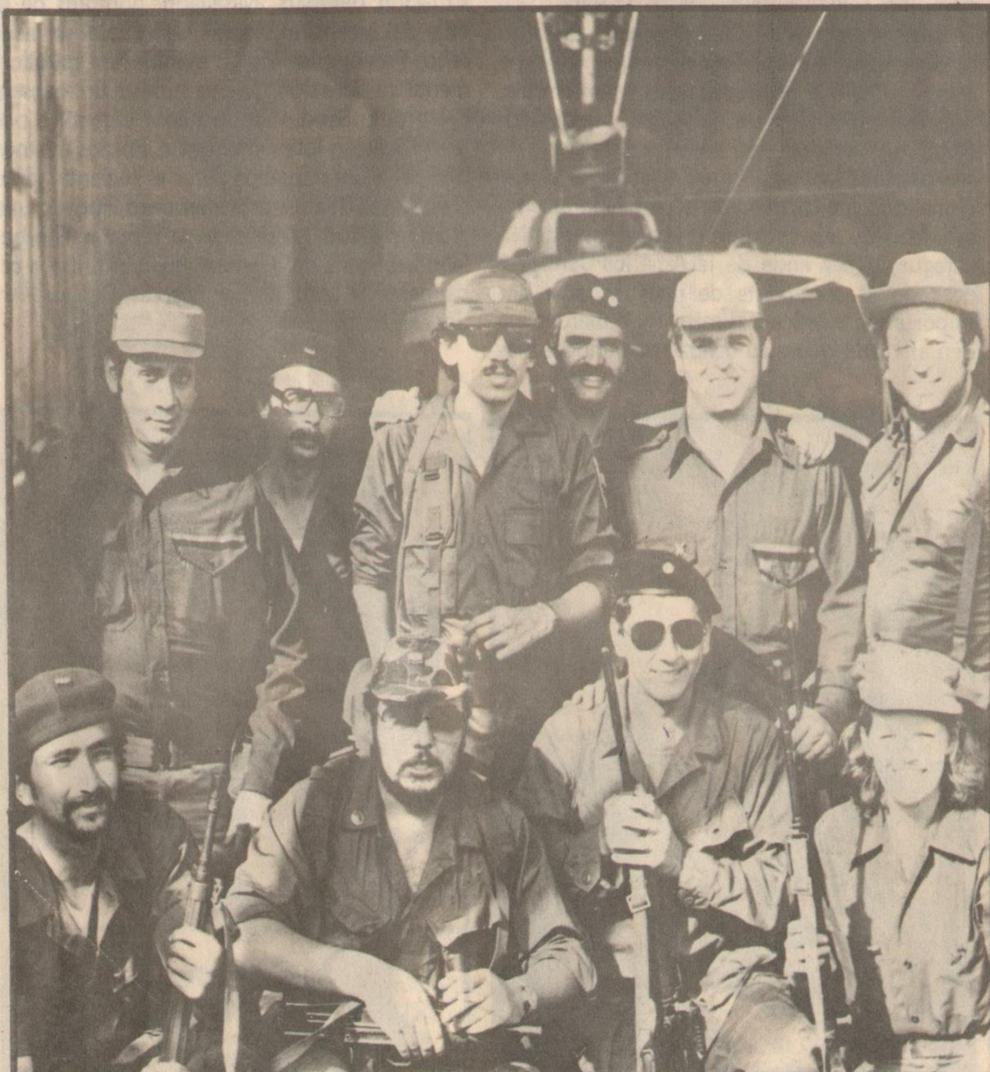
Cmdtes. Humberto Ortega y Víctor Tirado (FSLN) y Cmdte. Mario E. Firmenich y 2do. Cmdte. Fernando Vaca Narvaja: Sandinistas y Montoneros contra la oligarquía y el imperialismo.