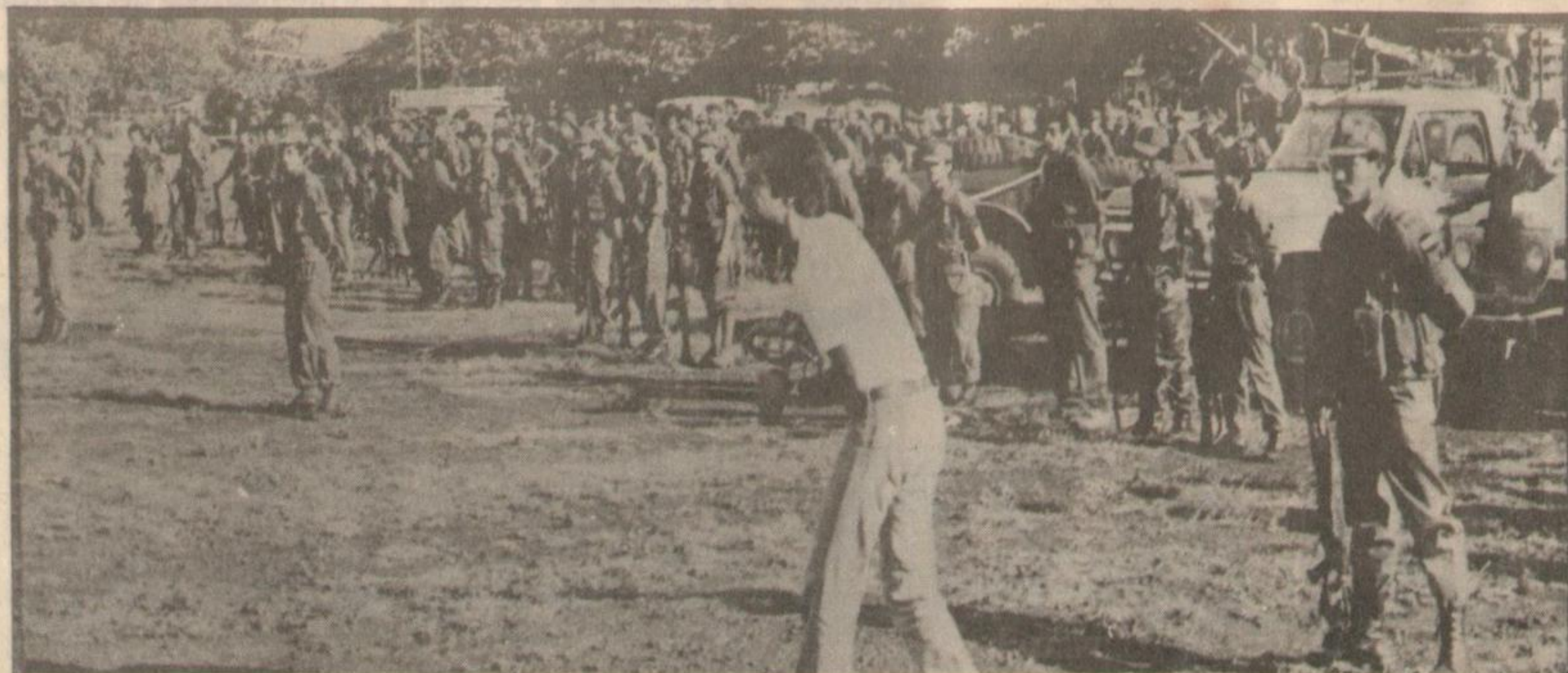
Ejército Sandinista: El Pueblo en armas por la Liberación.

Supieron partir de su historia de las experiencias e identidad de su propio Pueblo, tanto en lo político como en el terreno militar. Por ello el triunfo sandinista no es solamente la victoria frente a los 45 años de la dictadura de