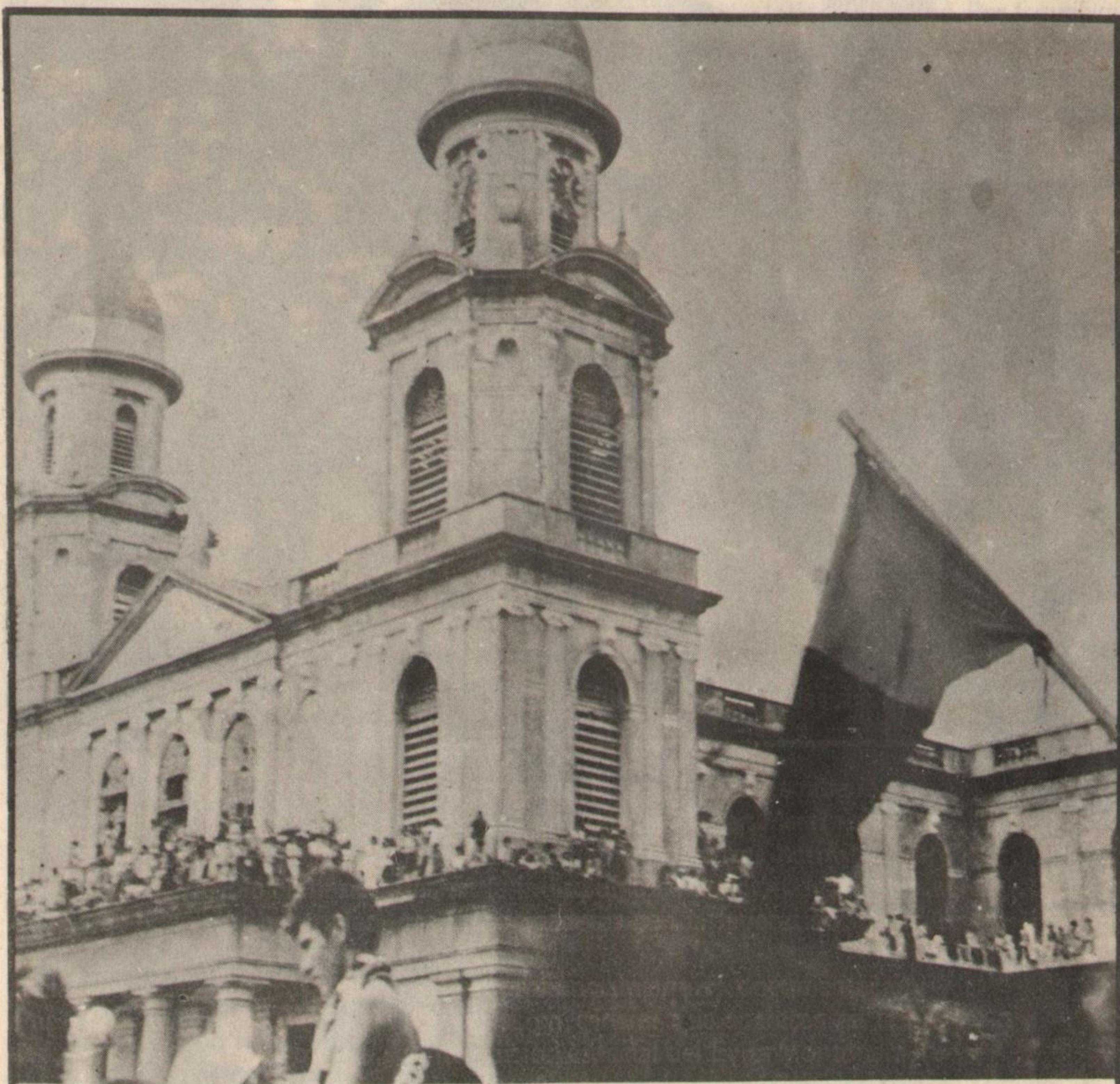
Vista de la Catedral de Managua: Como el 25 de Mayo de 1973

La provisión de armamentos y transportes a Somoza, la participación en maniobras diplomáticas concertadas con Estados Unidos para la prolongación del régimen mediante un "somocismo sin Somoza", la campaña histérica de la prensa controlada por la dictadura en defensa del "baluarte occidental y cristiano", fueron sepultadas por el empuje del pueblo nicaragüense y la solidaridad combativa de los pueblos latinoamericanos, una de cuyas expresiones más altas ha sido la de nuestro Partido, Ejército y Movimiento.